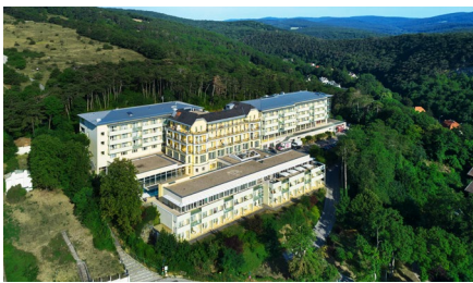
OptimaMed Rehabilitationszentrum Perchtoldsdorf